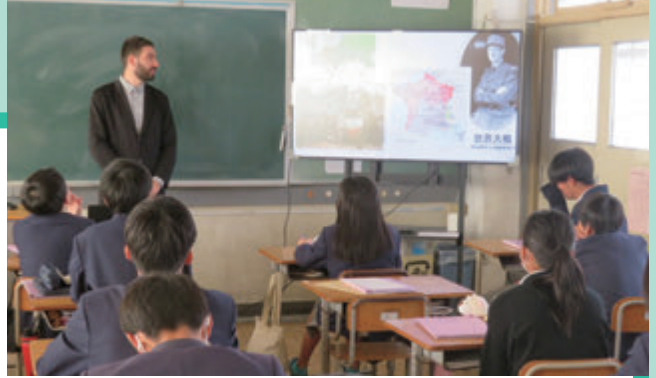
西宇治中学校への出前講座

また、多文化共生の実現のために、イベントだけでなく若者との触れ合いも重視し、小中高校からの派遣依頼を受けました。京都市内はもちろん、亀岡市や宇治市でも講座やグループワークを開催しました。生徒の皆さんの生き生きとした顔や感謝の言葉は一生忘れられません。この場を借りて改めてありがとうと伝えたい